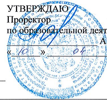
График предэкзаменационных консультаций Кафедра «Коммерция и гостеприимство» (наименования подразделения)

УТВЕРЖДАЮ Проректор по образовательной деятельности А.А.Панфилов « 10 » _____ 04 _____ 2017 г.